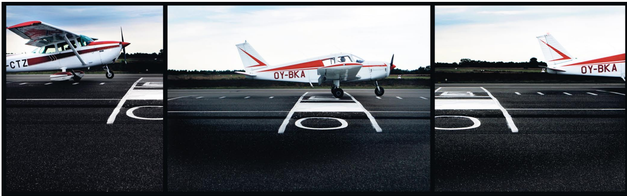
Tre fly fra Midtjysk Flyveklub flyver i morgen, onsdag, til Skive for at deltage i en konkurrence i præcisionslandinger. Det giver mange point at ramme præcist, mens der bliver trukket point fra, hvis man lander flyet kort af den hvide markering.